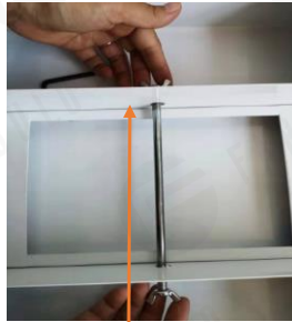
4. rögzítse a rudat