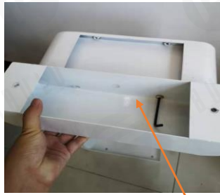
2. szerelje össze a két részt, és helyezze be a rudat