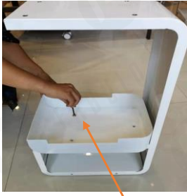
1. rögzítse ezt a részt 3 csavarral