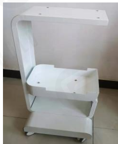
7. rögzítse az edzett üveget, majd fejezze be.