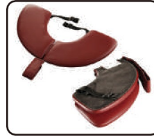
Első háttámla (csak ovális asztaloknál)