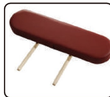
Oldalsó kartámaszok - 2x (csak UNO asztalok) Táska