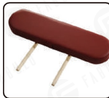
Oldalsó kartámaszok - 2x (csak UNO asztalok)