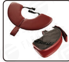
Elülső kartámla (csak az Oval asztaloknál)